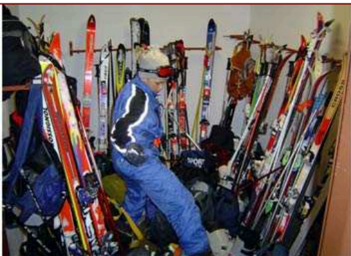
Po výcviku rychle odložit lyže.....