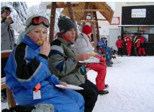
Jirkové, copak to jíme? To byste do oběda nevydrželi?