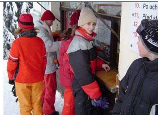
.....a zaútočit na stánek s občerstvením.