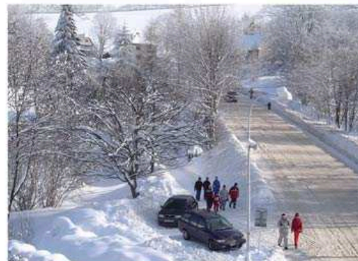
Z dopoledního výcviku se vrací poslední opozdílci.