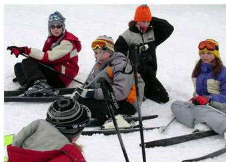
Tak holky, zvedat a jedem!