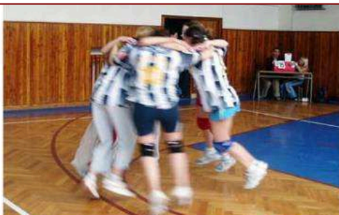
Vítězné "kolečko" následovalo po každém našem utkání! První místo a titul okresního přeborníka ve volejbalu po zásluze patřil dívkám naší školy.