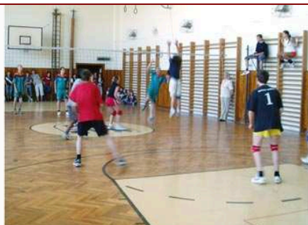
Po prvním prohraném utkání se ZŠ Boskovice, Sušilova měříme své síly s týmem ZŠ Rájec-Jestřebí.