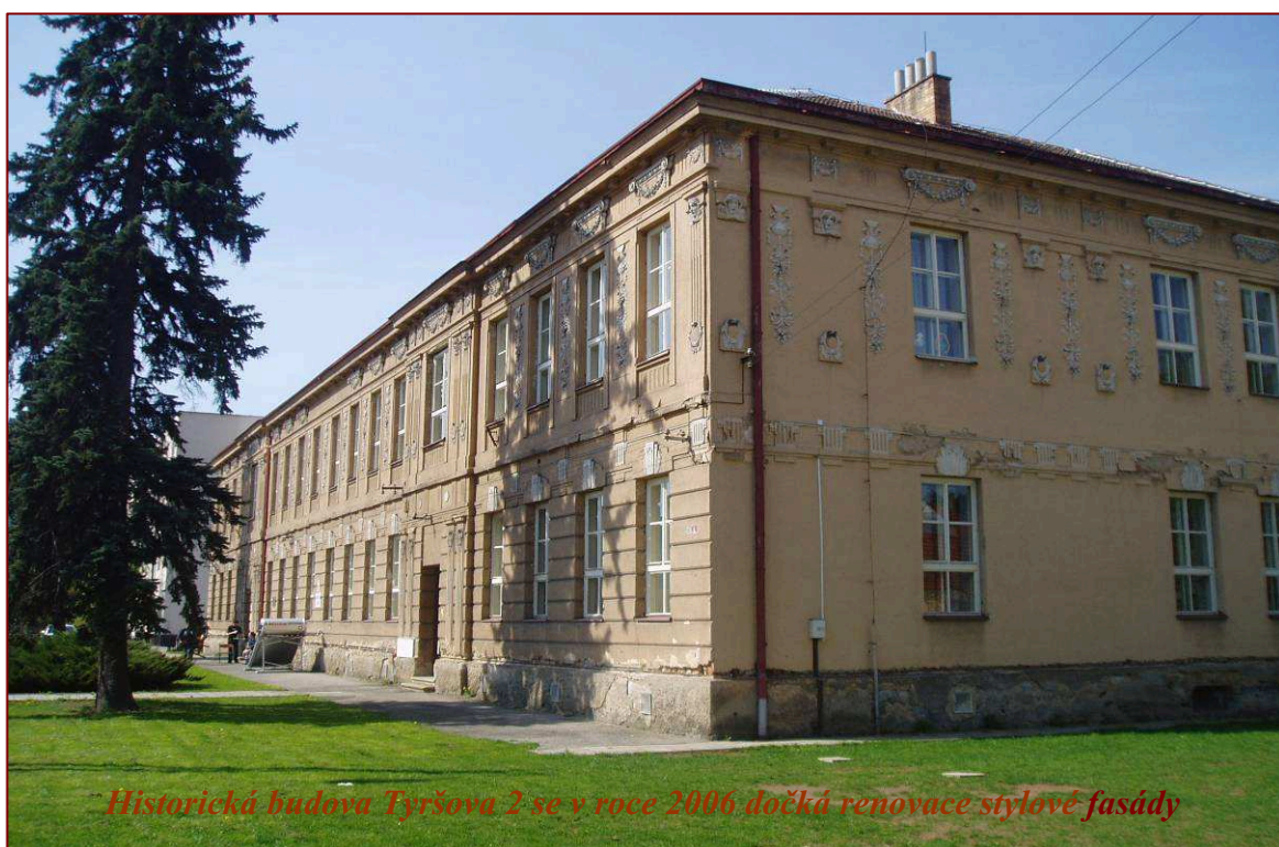
Historická budova Tyršova 2 se v roce 2006 dočká renovace stylové fasády