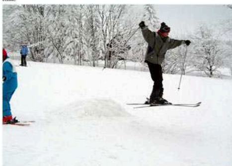
První družstvo zkouší něco navíc.