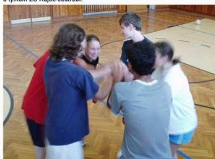
Konec oddechového času, .....