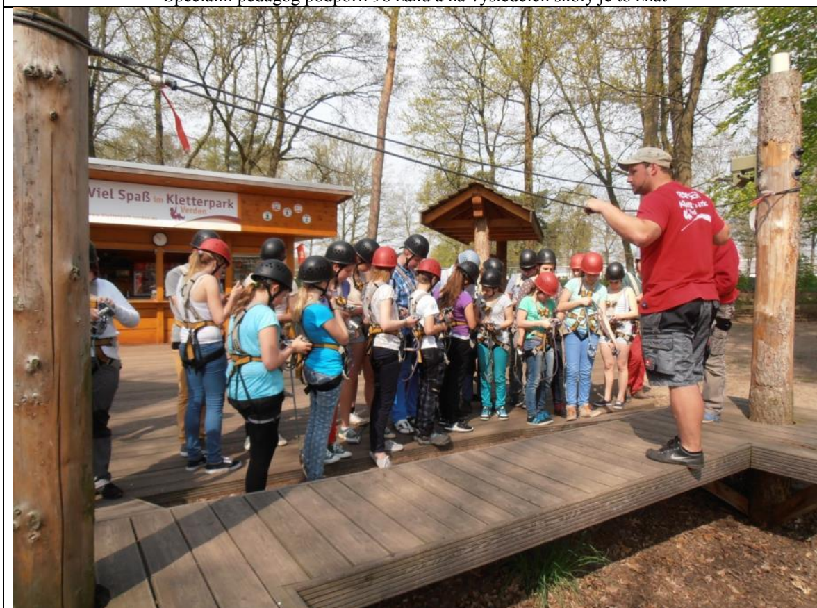
Z návštěvy v německém Kirchlintelnu