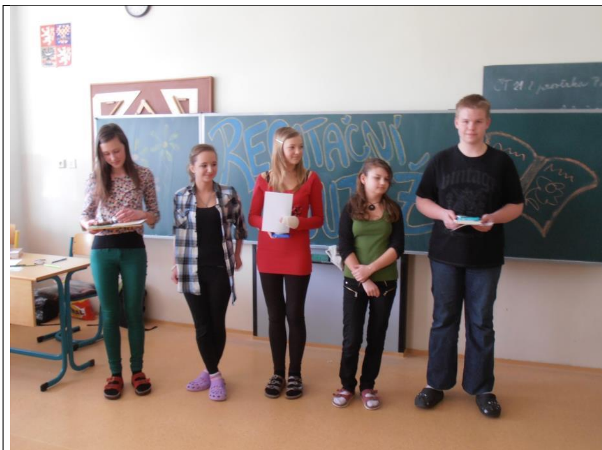
Školní kolo recitační soutěže