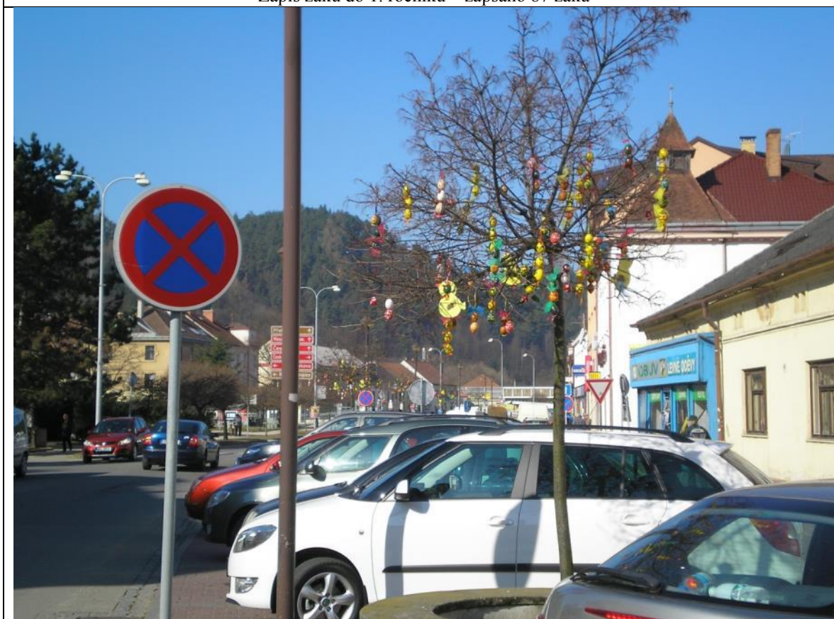
Velikonoční výzdobu letovického náměstí zajistí vychovatelky ŠD