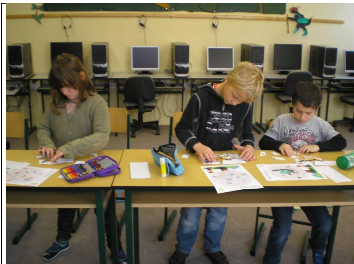
Speciální pedagog podpořil 98 žáků a na výsledcích školy je to znát