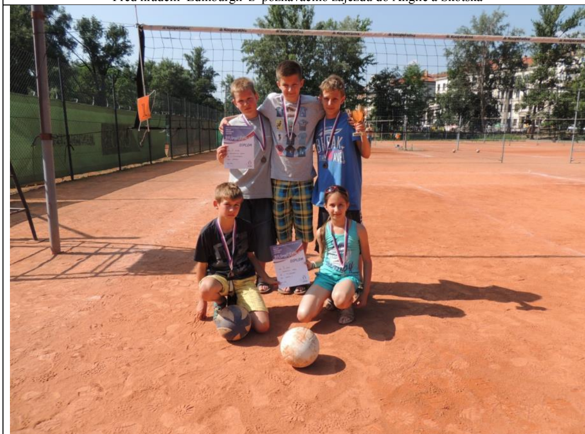
Největší sportovní úspěchy jsou tradičně volejbalové