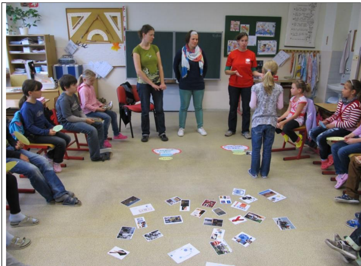
Žáci se dovídají informace o Haiti