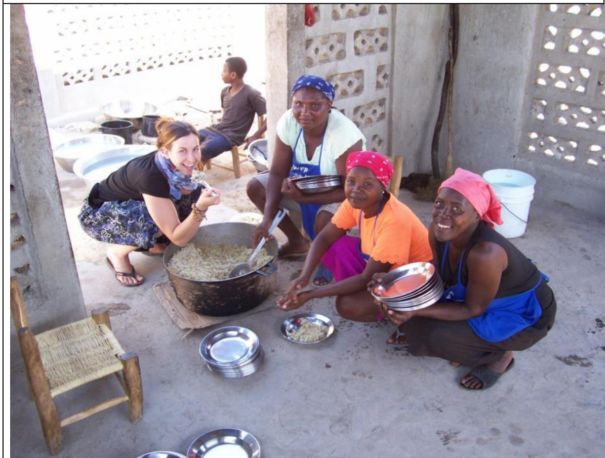
a to je školní jídelna na Haiti