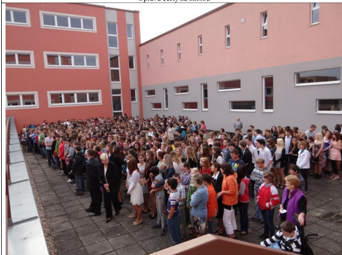
Poslední den školního roku na terase