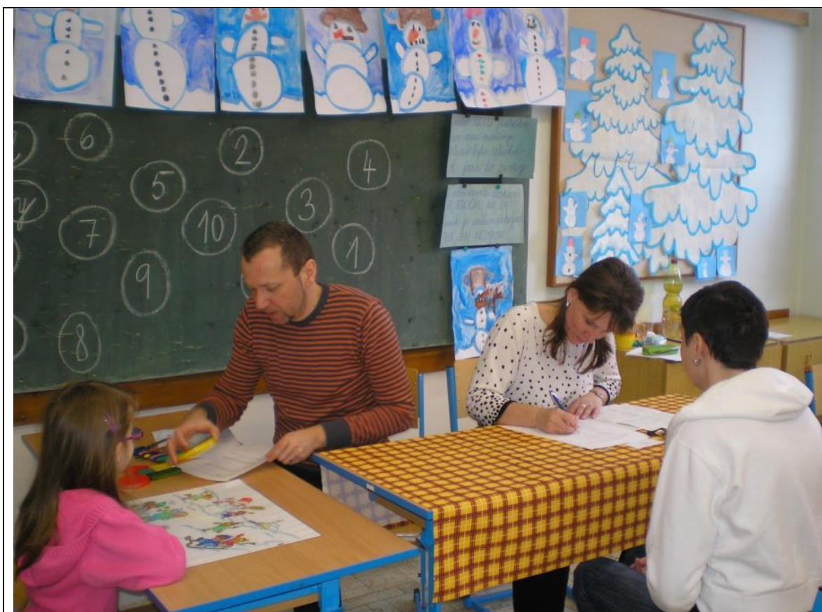
Zápis žáků do 1. ročníku – zapsáno 87 žáků