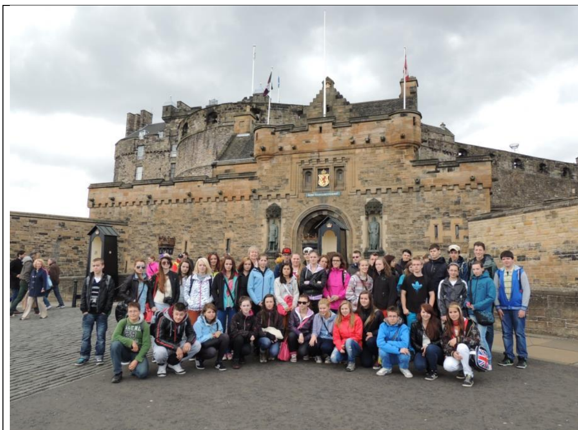
Před hradem Edinburgh z poznávacího zájezdu do Anglie a Skotska