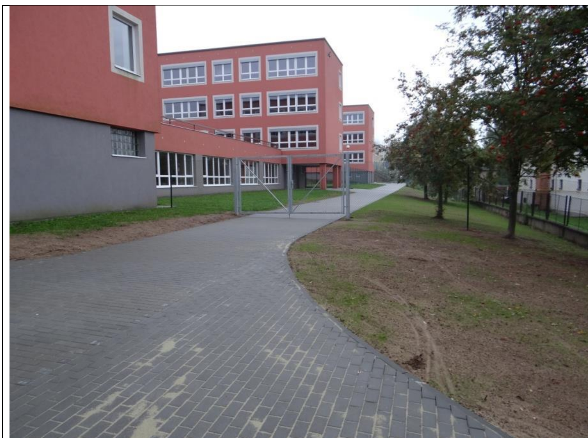
Oprava cesty za školou