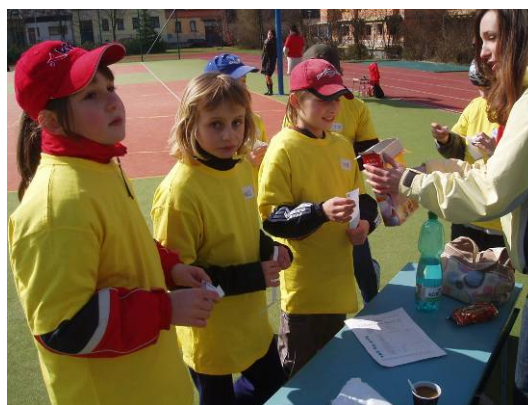
Dyskohry v Boskovicích