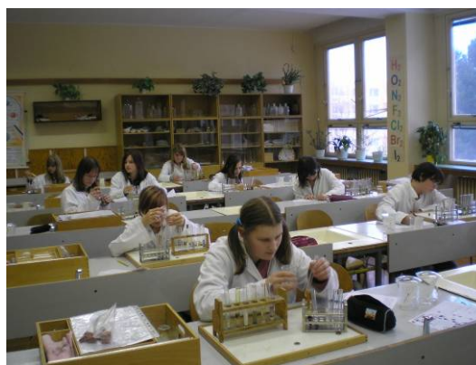
Učebny fyziky a chemie projdou v následujícím školním roce zásadní rekonstrukcí