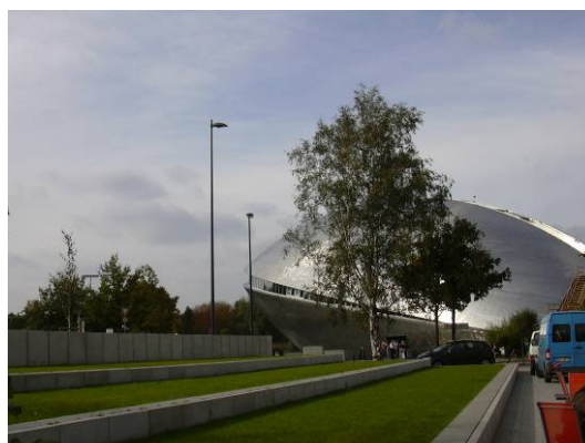
Naše návštěva v Kirchlintelnu