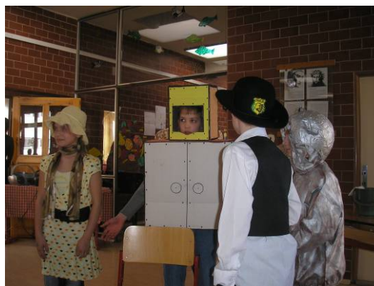
Představení kroužků anglického jazyka