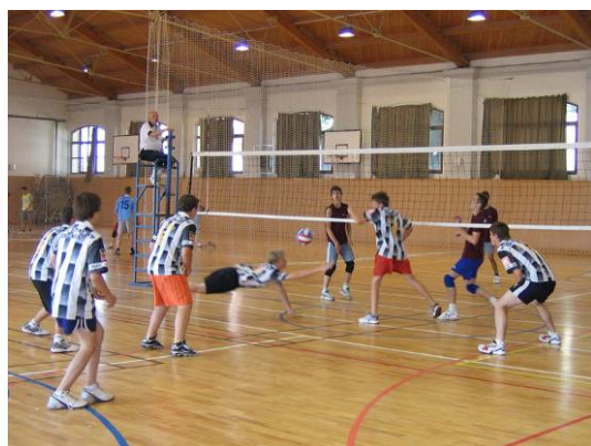
1. místo chlapců v krajském kole