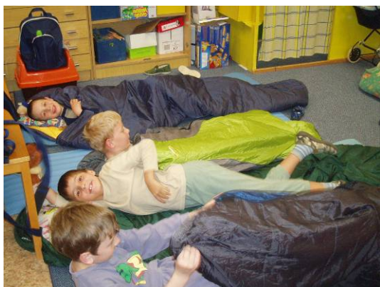
Společné akce školní družiny – přespání ve škole