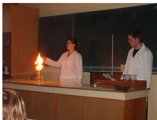
Atraktivní chemické pokusy