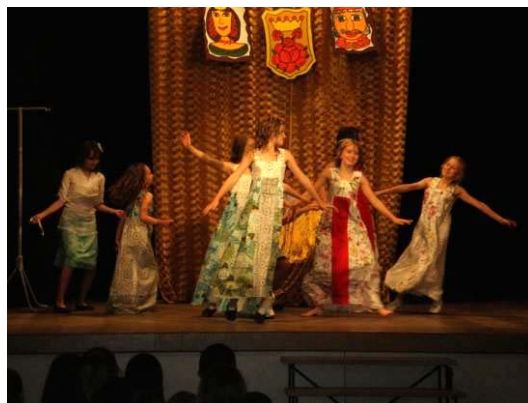
Představení žáků Tyršova