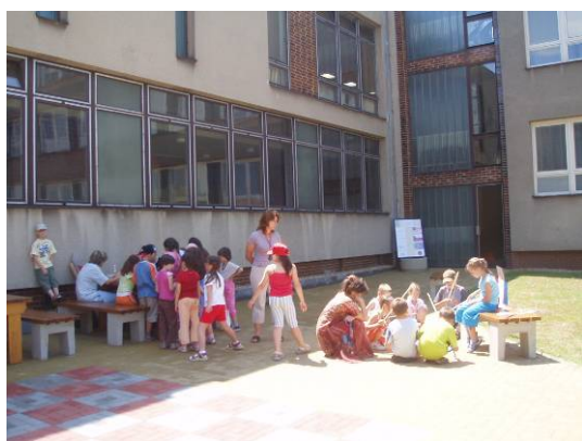
Nové dětské hřiště v plném provozu