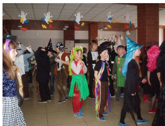
Společné akce školní družiny – „rej masek“