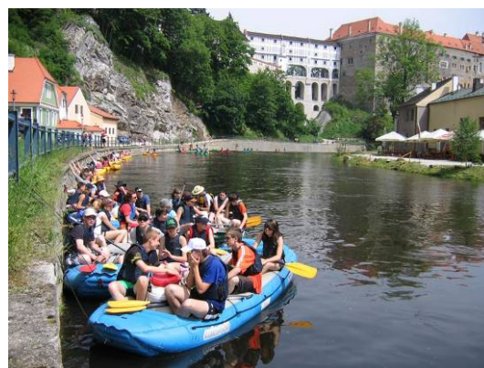
Vodácký kurz žáků 9. třídy