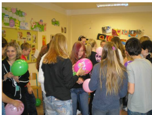
Široká nabídka volitelných předmětů