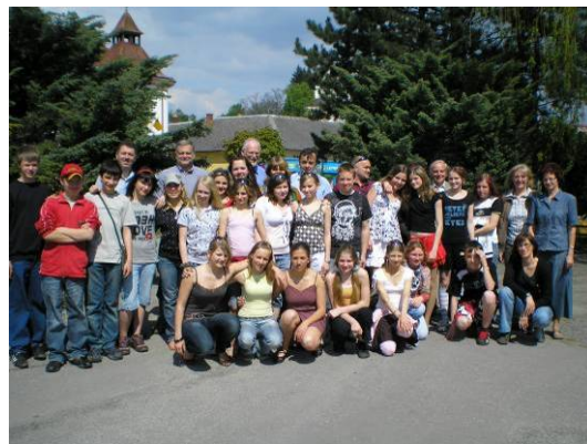
Němečtí přátelé v Letovicích