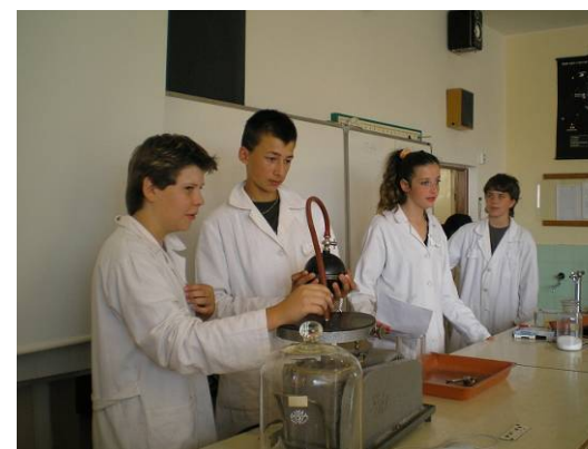
Zajímavé fyzikální pokusy